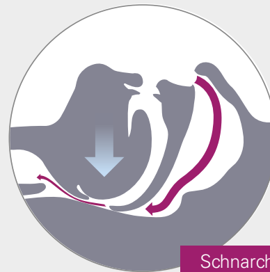
Schnarchen Gestörter Luftstrom