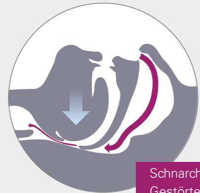
Schnarchen Gestörter Luftstrom

höhere Wahrscheinlichkeit, einen Verkehrsunfall zu haben 5