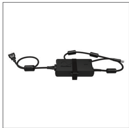
90W Strømforsyning 37346