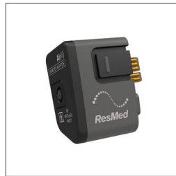
Oksymeteradapter 37302 XPOD LP Oksymeter 22374 Flerbruks soft-sensor (medium) - 3 m kabel 707560