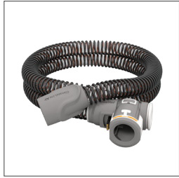
ClimateLineAir -slange 37296 ClimateLineAir Oxy 37357