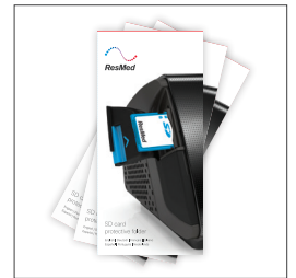
Omslag til SD-kort 37334 (1 pk) 37332 (10 pk) SD-kortleser 36931