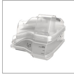
HumidAir varmfukter 37300 Vannkammer