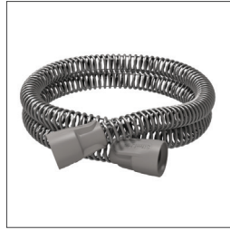
SlimLine -slange 36810