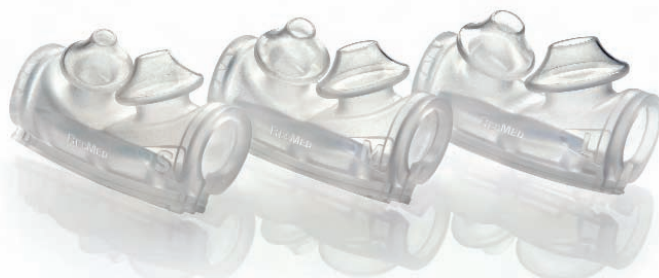
Chaque masque est fourni avec trois tailles de coussin pour convenir à tous les patients.